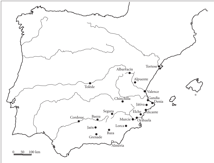
CARTE 1. — Villes et sites associés avec la taifa de Denia

prononceront le nom de ‘Alī dans les églises dans l’ensemble de ses territoires ( a‘māl ). L’utilisation de ce terme reflète probablement l’organisation administrative de la taifa et le fait que ‘Alī ordonnera à chacun de ses gouverneurs d’instaurer dans leurs districts les mesures décrites par le texte.