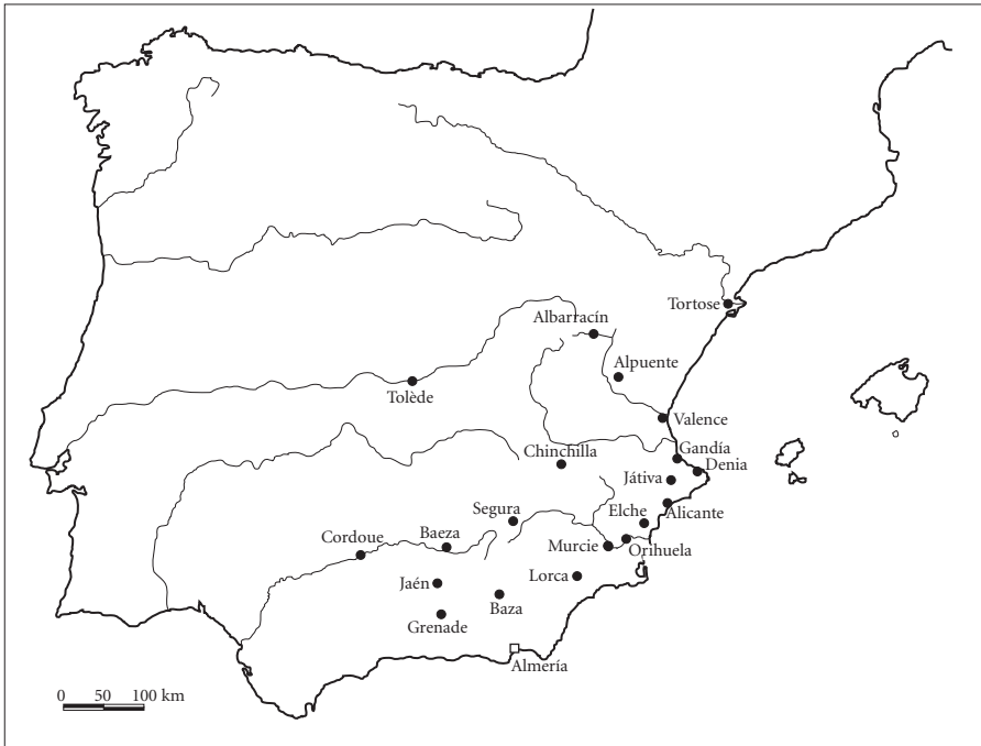
CARTE 1. — Villes et sites associés avec la taifa de Denia

prononceront le nom de ‘Alī dans les églises dans l’ensemble de ses territoires ( a‘māl ). L’utilisation de ce terme reflète probablement l’organisation administrative de la taifa et le fait que ‘Alī ordonnera à chacun de ses gouverneurs d’instaurer dans leurs districts les mesures décrites par le texte.